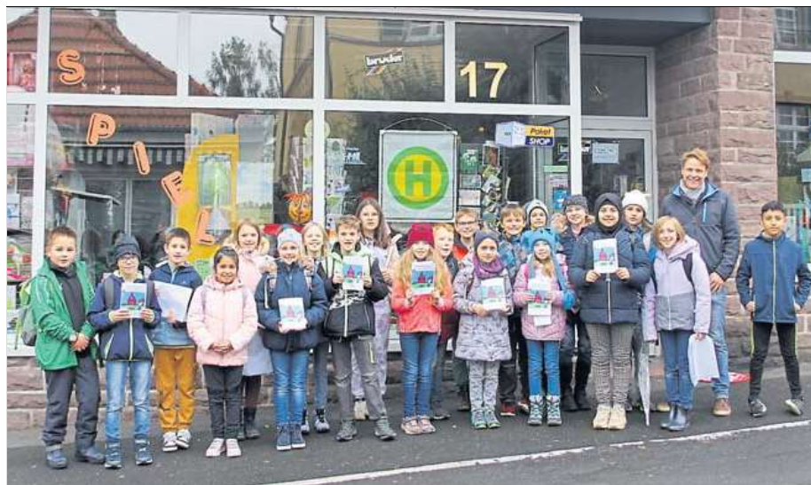
Die Schüler und Schülerinnen der Klasse 4c der Dieffenbachschule sind sehr stolz auf ihr Werk.

Das Pony konnte durch eine Tierärztin beruhigt werden. Um weitere Untersuchungen vorzunehmen, wurde das Pferd zur Beobachtung in die Praxis gebracht. Die Autobahn war in Fahrtrichtung Norden eine halbe Stunde gesperrt, es kam zu einem zwei Kilometer langen Stau. kw