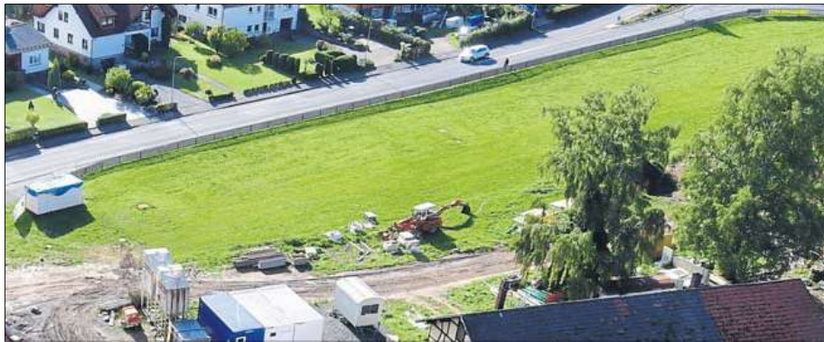
Ein erster Entwurf für die Freiflächenplanung im Hahnekiez sieht unter anderem vor, dass die Wiese zur Herrngartenstraße hin weitgehend erhalten bleiben soll. Von dem geplanten Café/Bistro in Gebäude K (unten rechts) soll ein Fußweg zur Bushaltestelle in der Herrngartenstraße angelegt werden. Zudem ist vorgesehen, ein Teil des Sengelbaches offen über das Gelände mäandern zu lassen.

Das gilt etwa im Bezug auf die Parkplätze, die von der Hainbuche aus angefahren werden können, und beidseitig der Anfahrt zur Kulturhalle im vorderen Bereich des Geländes vorgesehen sind. „Der Denkmalschutz besteht darauf, dass der Blick auf die Burgen nicht behindert wird. Die Eisteiche stehen als Teil des Ensembles ebenfalls unter Schutz und auch aus Naturschutzgründen sind Eingriffe schwierig“, betonte der Bürgermeister. Der Teich bleibe