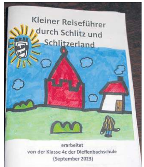
Der Reiseführer der Klasse 4c.